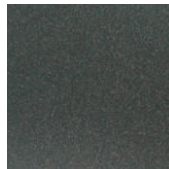
DB 703 Metallic glatt