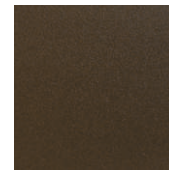
Rostiges eisen Feinstruktur