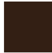
6768 BRAUN Feinstruktur