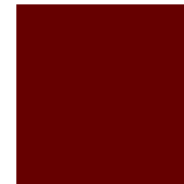
RAL 3004 Matt/ Feinstruktur