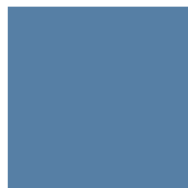
RAL 5007 Matt/ Feinstruktur