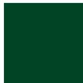
RAL 6005 Matt/ Feinstruktur