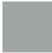
RAL 7004 Matt/ Feinstruktur