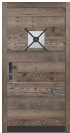
HTF 103 Q