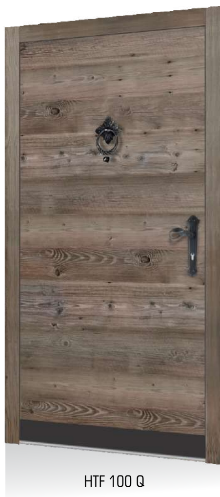
HTF 100 Q