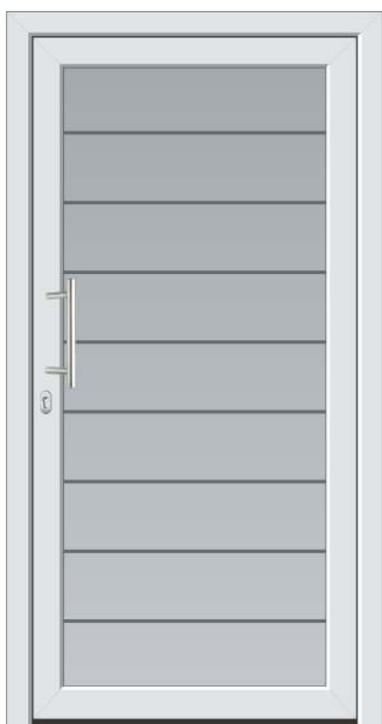
CT 01; steklo SG 867