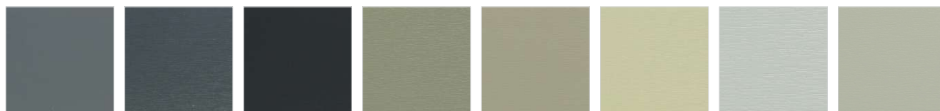
RAL 7015 G Schiefergrau