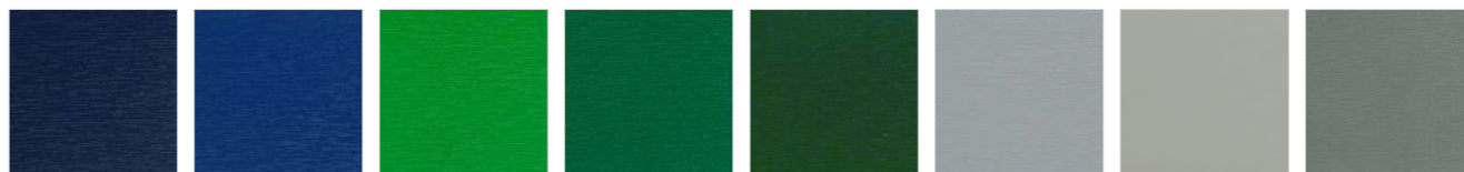
RAL 5011 S Stahlblau