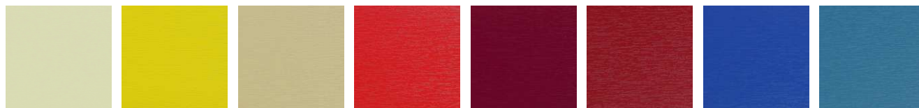
RAL 1015 S Hellelfenbein