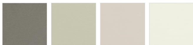
RAL 7039 S G Quarzgrau