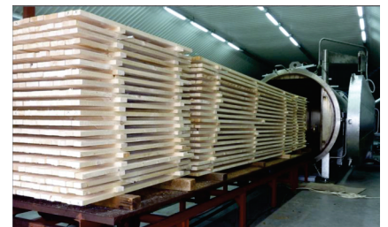
Silvapro ® Wood

für Holzfenster INO-80 und Holz/Aluminium-Fenster. Durch ein umweltfreundliches Wärmebehandlungsverfahren in Spezialkammern wird bei Temperaturen von 170-240 Grad das Fichte Holz ohne Einsatz von chemischen Substanzen erhitzt.