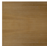
thermo modifizierte Fichte