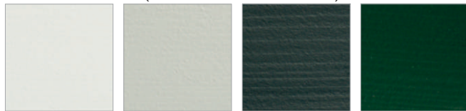
R D 21

Pokrivne barve (struktura lesa ni vidna)